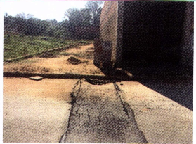
Rua Antônio M. Salvador 527 (2)