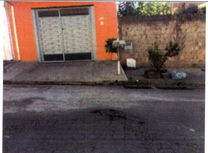
Rua Antônio M. Salvador 309