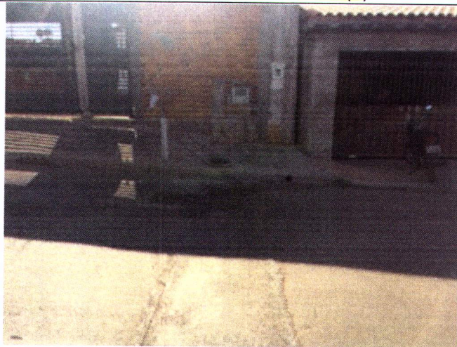
Rua Antônio M. Salvador 355